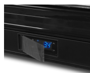
Ochranný kryt na termostat