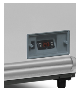
Digitální ukazatel teploty