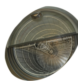
Vnitřní ventilátor a koš