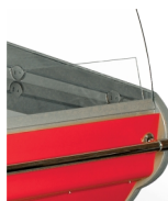
Vyhřívané přední sklo