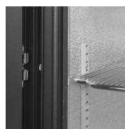
Zarážka dveří pro bezpečnou nakládku