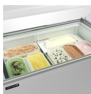
Na objednávku: koš na vaničky na zmrzlinu