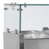
Prosklené víko na ochranu potravin